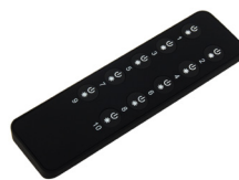
LC-002-021 LED RF Controller Mono - 10 Zonen Fernbedienung LED RF Controller Mono - 10 zones remote