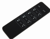
LC-002-014 LED RF Controller Mono - 4 Kanal Fernbedienung LED RF Controller Mono - 4 channel remote