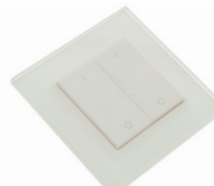
LC-002-017 LED RF Controller Mono - 2 Zonen Funktaster LED RF Controller Mono - 2 zone radio push button