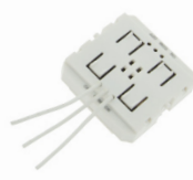
LC-002-015 LED RF Controller Mono - Doppeltastermodul LED RF Controller Mono - Double push button module