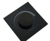
LC-002-012 LED RF Controller Mono - Wand Sender schwarz LED RF Controller Mono - wall remote black