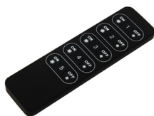
LC-002-011 LED RF Controller Mono - 5 Zonen Fernbedienung LED RF Controller Mono - 5 zones remote