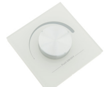
LC-002-013 LED RF Controller Mono - Wand Sender weiss LED RF Controller Mono - wall remote white