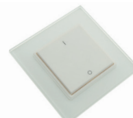
LC-002-016 LED RF Controller Mono - 1 Zonen Funktaster LED RF Controller Mono - 1 zone radio push button