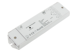
LC-002-010 LED RF Controller Mono - Empfänger LED RF Controller Mono - receiver