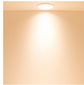
Ultra Warm Weiss